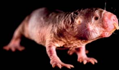
NACKTMULL BEI DER STIMMAUFNAHME