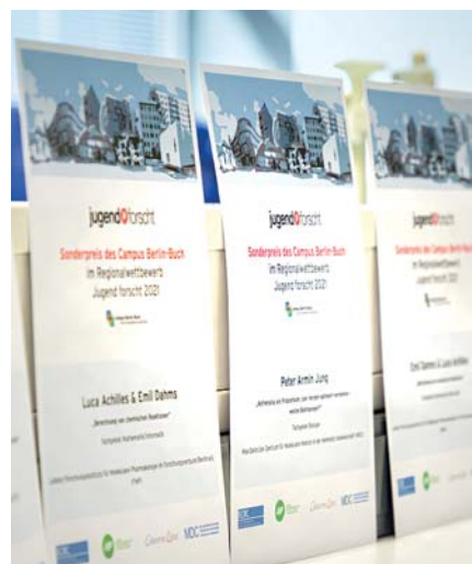
DIE GEWINNER ERHIELTEN IHRE URKUNDEN IN DIESEM JAHR PER POST