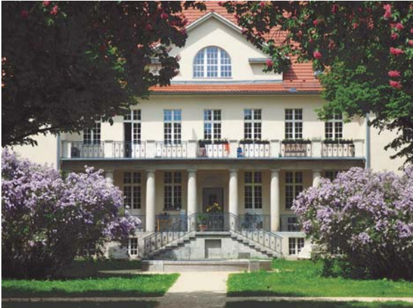
WOHNEN IN DENKMALEN

Text: Dr. Ingolf Neunübel, Foto und Abb.: Ludwig Hoffmann Quartier