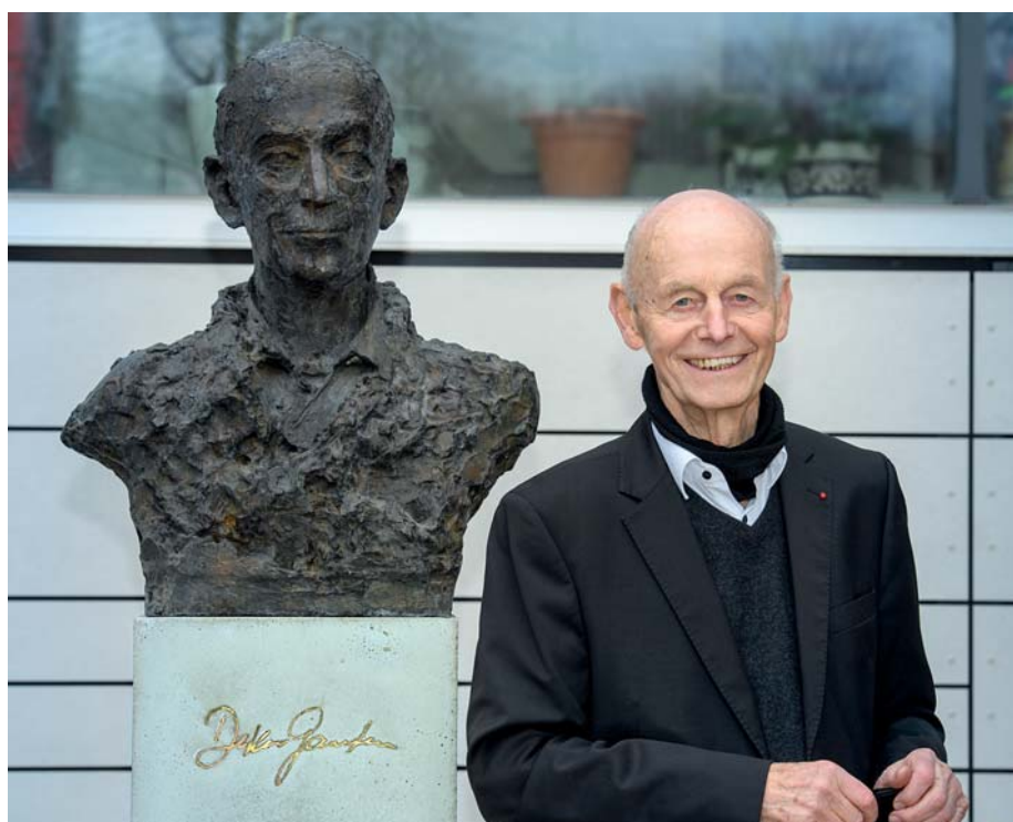
DIE PORTRÄTBÜSTE, DIE DIE KÜNSTLERIN ANNA FRANZISKA SCHWARZBACH SCHUF, STEHT VOR DEM MAX-DELBRÜCK-HAUS

Schließlich der Ruf nach Berlin. „Wir wollten eine freiheitliche Wissenschaft einführen und die Bereitschaft zur weltoffenen