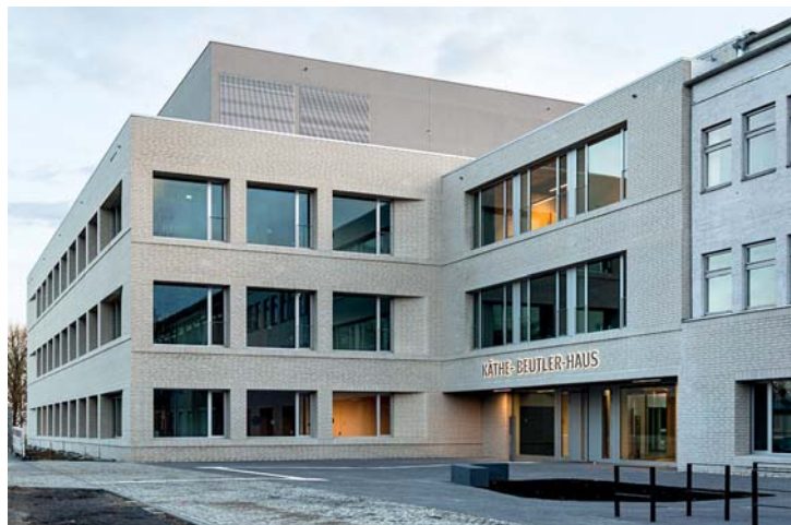
BLICK AUF DEN VORPLATZ UND DEN HAUPT-EINGANG DES KÄTHE-BEUTLER-HAUSES AM LINDENBERGER WEG