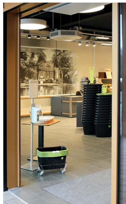
EIN WANDPOSTER IM BIO-MARKT ERINNERT AN DIE ORANGERIE IM SCHLOSSPARK

Die Schlosspark-Passage wird täglich gereinigt, doch immer wieder führen Achtlosigkeit oder auch Vandalismus dazu, dass die Passage manchmal ungepflegt wirkt. „Alle, die sich hier aufhalten, sollten respektvoll mit dem zentralen Ort in Buch umgehen“, so der Schlosspark-Manager. „Wir tragen dazu bei, dass Buch sich entwickelt und wünschen uns natürlich, dass diese positive Entwicklung auch im Erscheinungsbild ablesbar ist.“