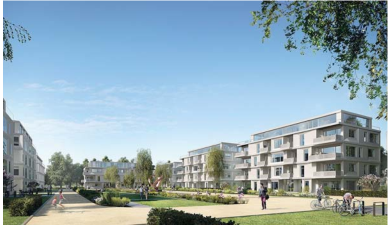
GEPLANTES NEUBAUPROJEKT W 100

Im neunten Jahr der seit 2012 laufenden Arbeiten am Ludwig Hoffmann Quartier in Berlin-Buch verändern sich die Schwerpunkte. Im Rahmen der Umwandlung eines 28 Hektar großen historischen Krankenhausstandortes in eine moderne Wohnanlage ging es zuerst um die Sanierung und Neubestimmung des Gebäudebestandes.